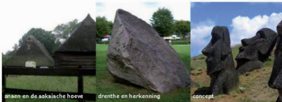
ansen en de saksische hoeve